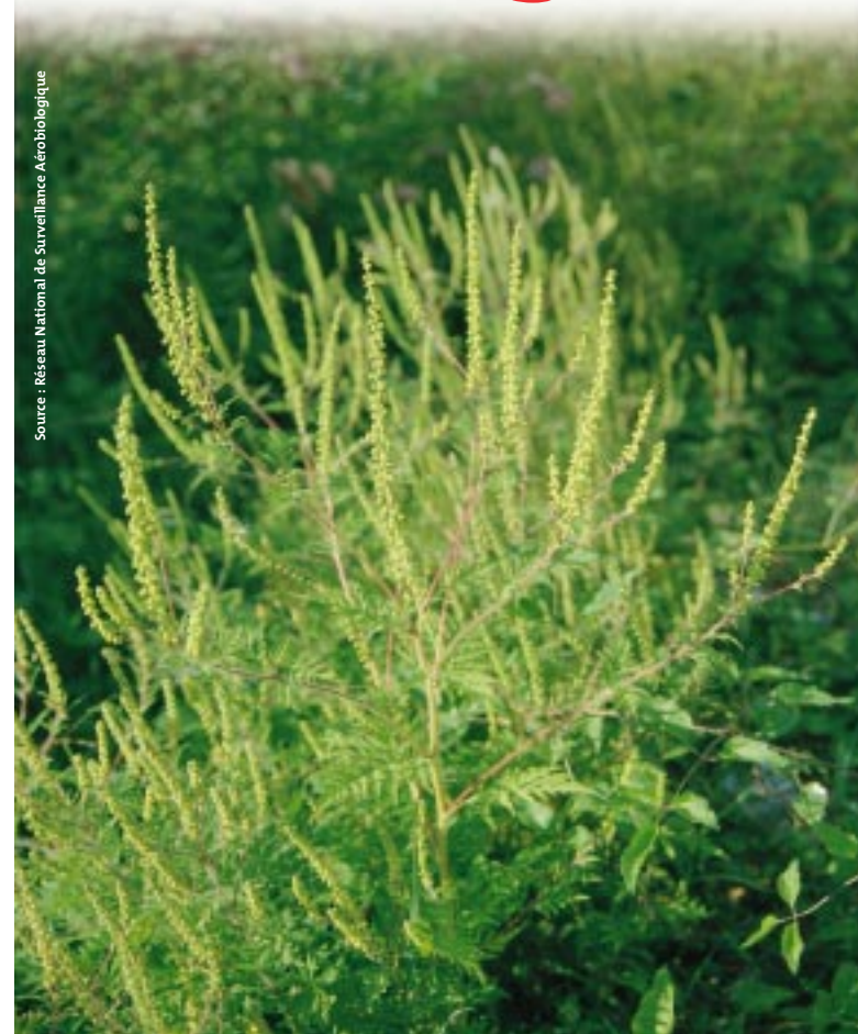
AMBROISIE EN FLEUR