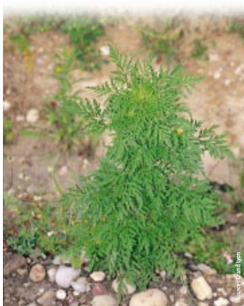
L'AMBROISIE AVANT FLORAISON