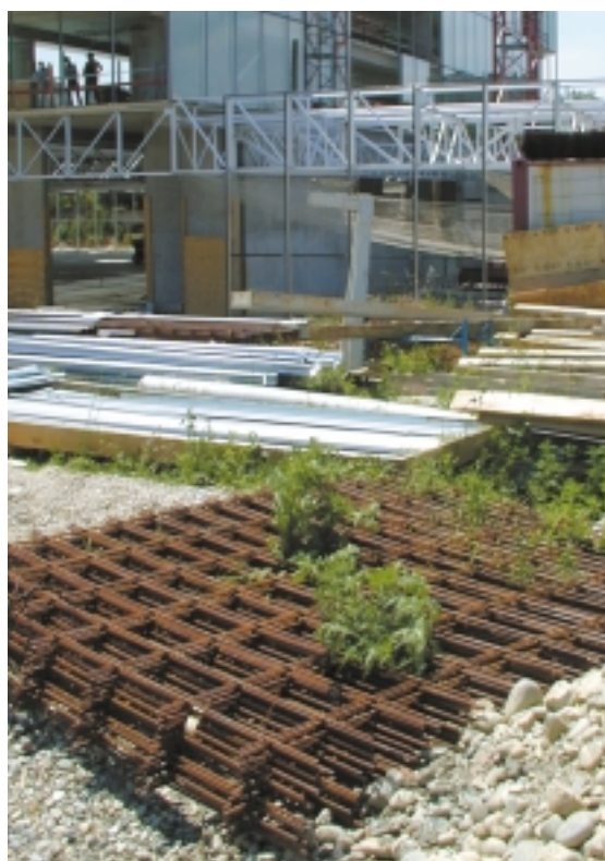
Toutes les zones de chantier et de stockage de matériaux sont propices à l'installation de l'ambrosie.